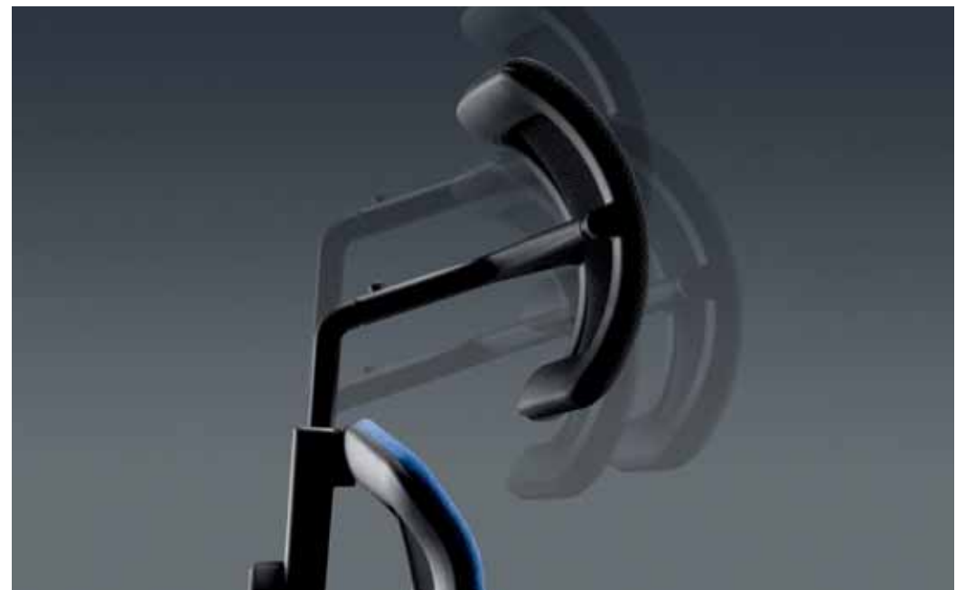
Die Kopfstütze ist in der Höhe, Tiefe und Neigung verstellbar