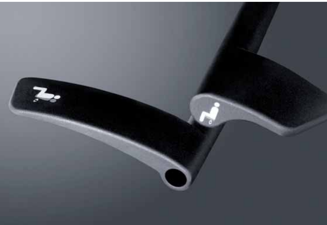
Intuitive Bedienhebel zur Einstellung auf das Körpergewicht, breites Spektrum von 45 Kg –130 Kg