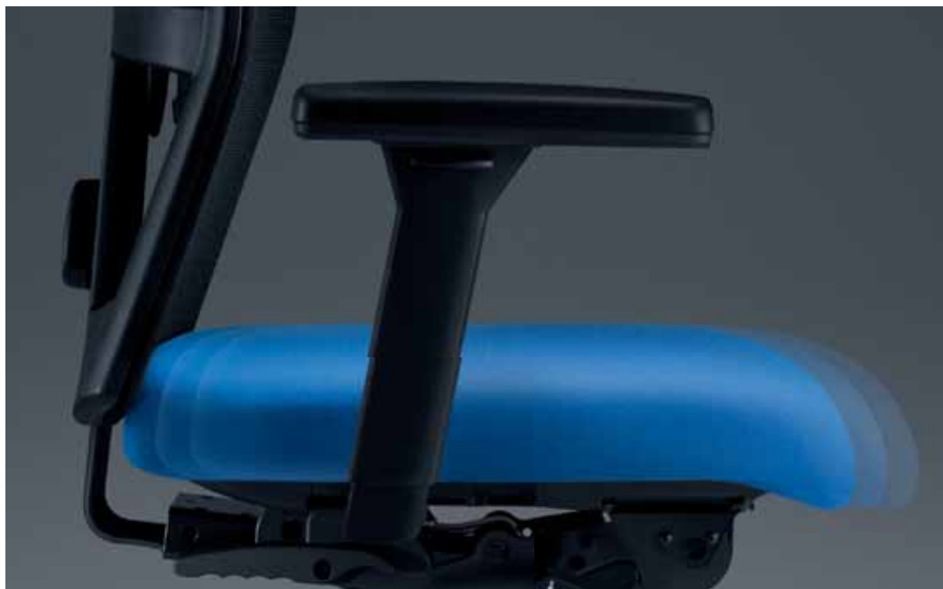
Die Sitztiefenverstellung ermöglicht eine individuelle Einstellung auf die Oberschenkelänge