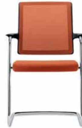
Freischwinger, mit Armlehnen