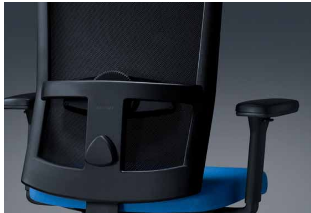
Formschön gestalteter und geschwungene Rückenlehne, Verarbeitung mit Detailliebe