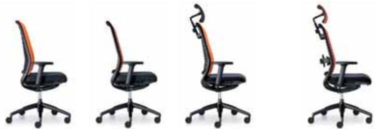
162H Drehstuhl mittelhoch, Rücken gepolstert, Armlehnen opt. 172H Drehstuhl mittelhoch, Rücken netzbespannt, Armlehnen opt. 265H Drehsessel, Rücken gepolstert, Kopfstütze, Armlehnen opt. 275H Drehsessel, Rücken netzbespannt, Kopfstütze, Armlehnen opt.