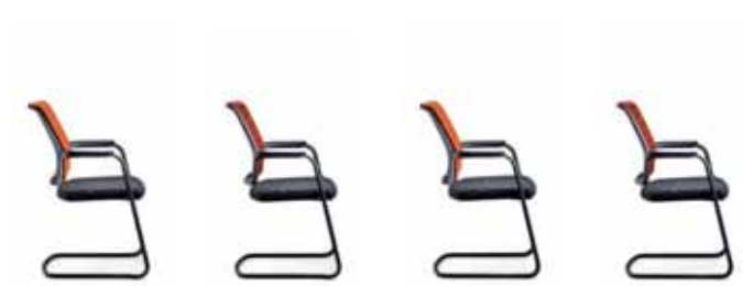
550H Freischwinger Rücken gepolstert, stapelbar 570H Freischwinger Rücken netzbespannt, stapelbar 555H Freischwinger Rücken gepolstert 575H Freischwinger Rücken netzbespannt