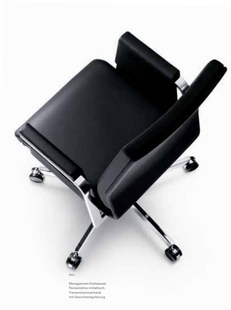
262A Management-Drehsessel, Rückenlehne mittelhoch, Transmotionmechanik mit Gewichtsregulierung