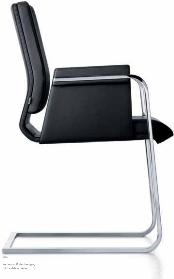
550A Konferenz-Freischwinger, Rückenlehne nieder