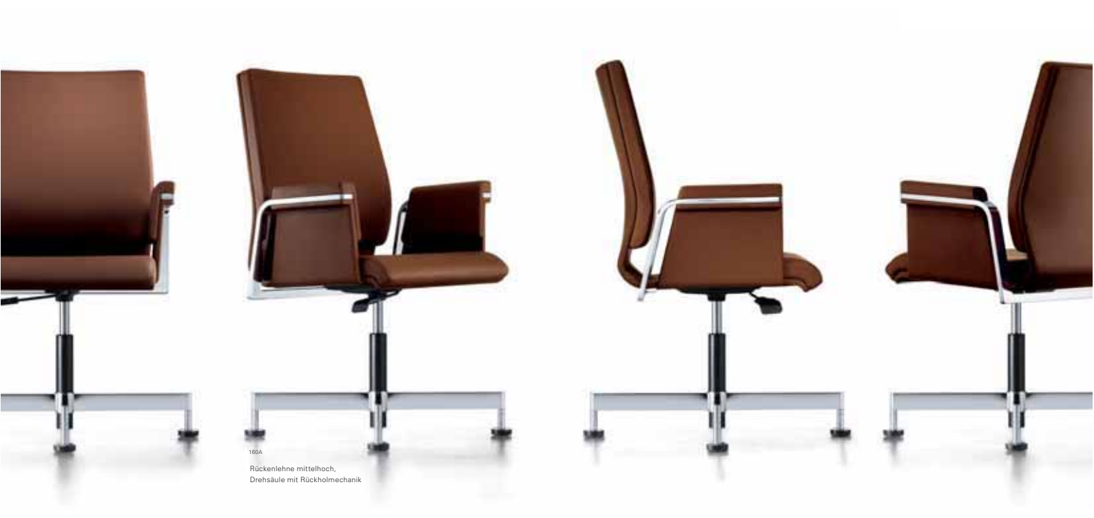
100A Rückenlehne mittelhoch, Drehsäule mit Rückholmechanik