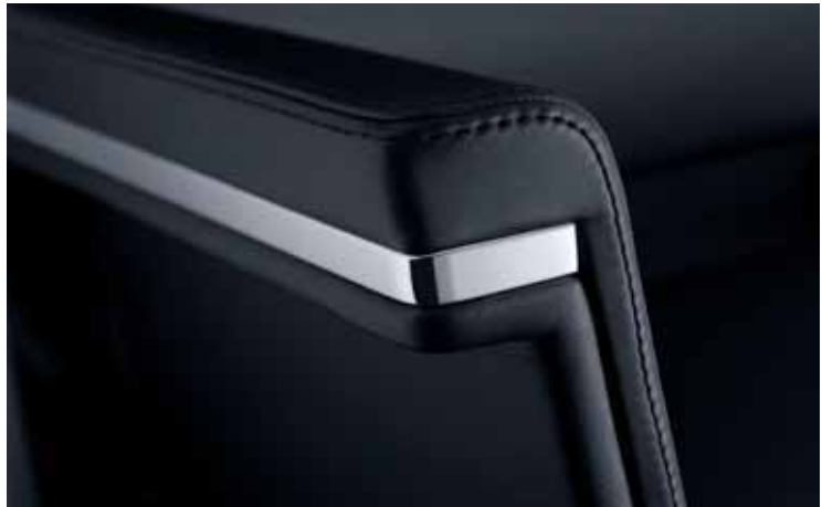
Interessanter Kontrast der Materialien Leder und Chrom in feinsten Verarbeitung