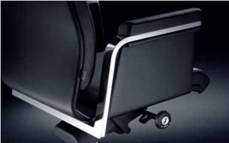
Perfekte Linienführung, selbsterklärende hochwertige Bedienelemente