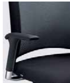
Rückenlehne in Polster-Ausführung Rückenlehne in Netz-Ausführung