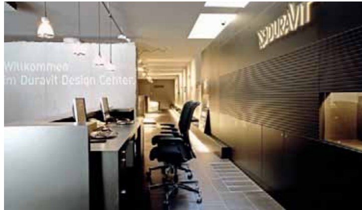
Xantos, Duravit Design Center, Hornberg