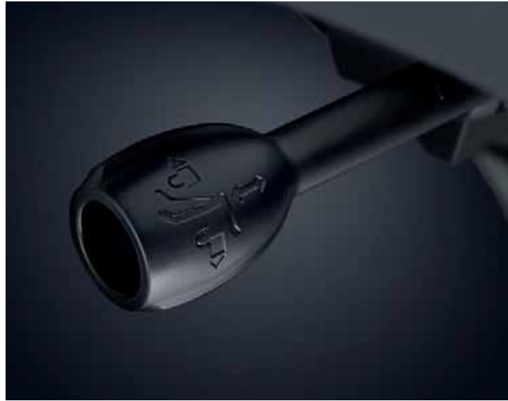
Bedienhebel mit selbsterklärender, intuitiver Verstellung