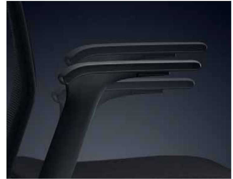
Breiten- und höhenverstellbare Armlehnen