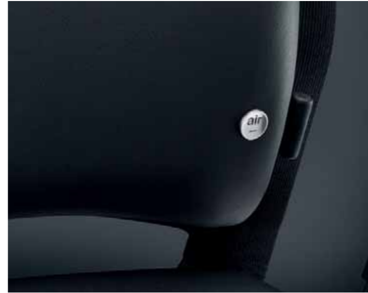
Die Lordosenstütze lässt sich auf die gewünschte Höhe verschieben. Air Pressure-Technologie ermöglicht eine individuelle Einstellung des Stützvolumens