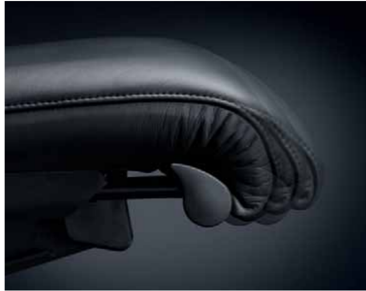
Die Astiv Sitzverstellung verlängert effektiv die Sitzfläche und somit die Auflagefläche für die Oberschenkel