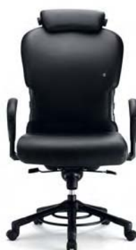
O 665 Rückenlehnenhöhe 78 cm