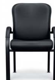
O 450 Besucherstuhl