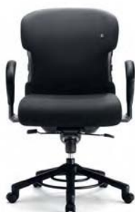
O 652 Rückenlehnenhöhe 56 cm

Auf alle Modelle des XXXL gewährt Interstuhl eine Langzeitgarantie von fünf und eine Vollgarantie von drei Jahren.